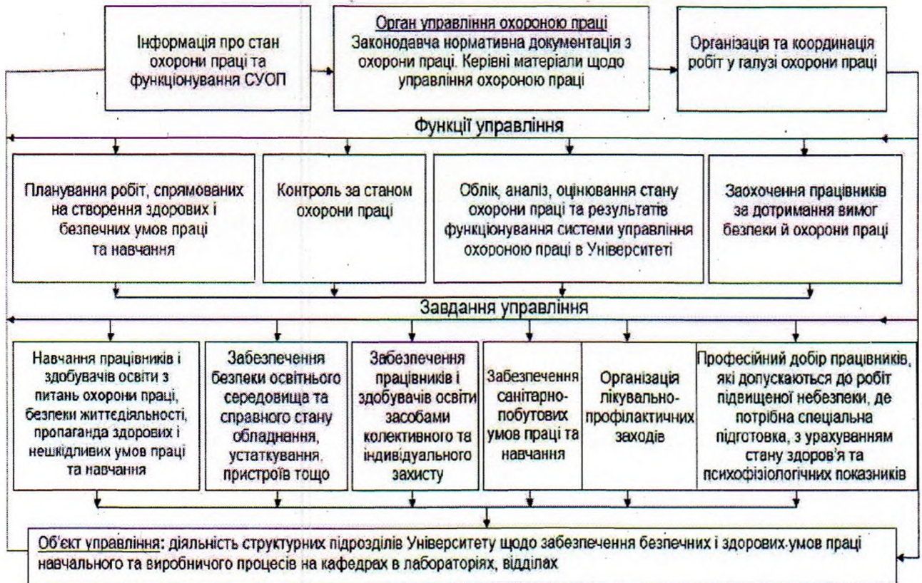
Схема функціональних взаємодій у вирішенні завдань СУОП